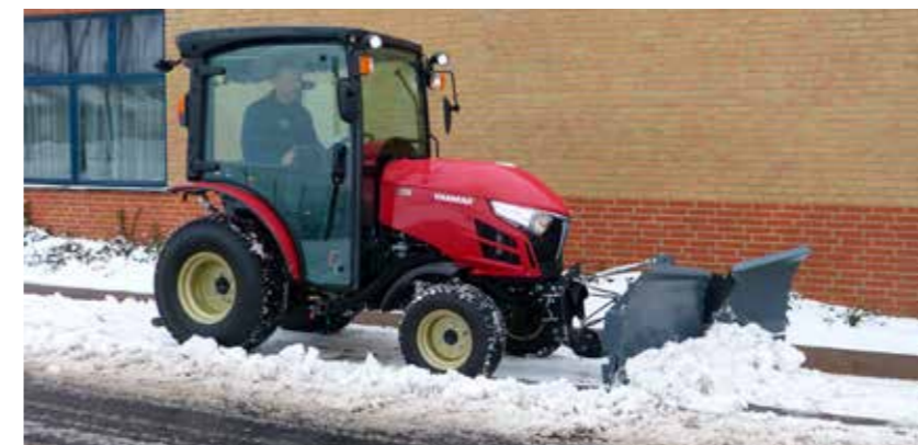
Eine umfangreiche Auswahl an Aufsatzgeräten machen diese Traktoren zu wahren „Allroundern“

Für eine intuitive Bedienung sind die Hebel praktisch und ergonomisch an beiden Seiten des Fahrers angebracht.