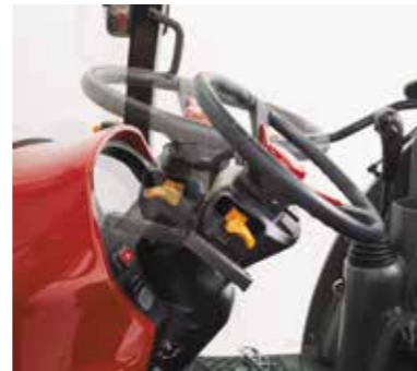
Verstellbares Lenkrad für eine perfekte Anpassung an den Fahrer

Durch das verstellbare Lenkrad kann der Fahrer die Maschine passend auf seine Körpergröße, -haltung und sein Komfortempfinden einrichten.