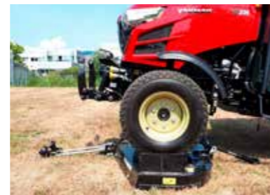
Zwischenachsmähwerk mit Überfahrfunktion

Der völlig neu entwickelte Yanmar-Frontlader kann ganz einfach montiert bzw. demontiert werden und bietet ein Höchstmaß an Hubkapazität. Der Lader wurde zusammen mit dem Traktor entworfen, so dass beide perfekt zusammenpassen.