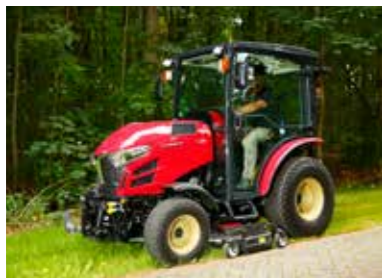
Die Präzision des mittigen Mähwerks