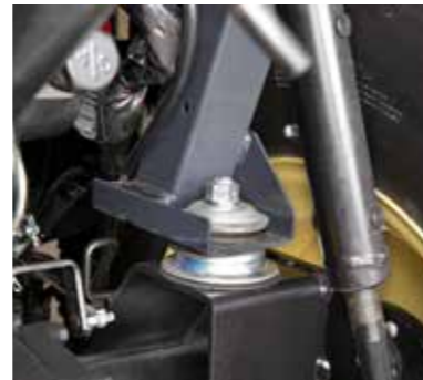
Werkseitig installiert für Präzision

Ein speziell entwickeltes System aus schwingungsfreien Karosserieauflagen aus Gummi überträgt kaum noch Geräusche und Schwingungen auf den Fahrerbereich, so dass ein komfortables Arbeiten ohne die üblichen Ermüdungserscheinungen auch während einer mehrstündigen Arbeit möglich ist.