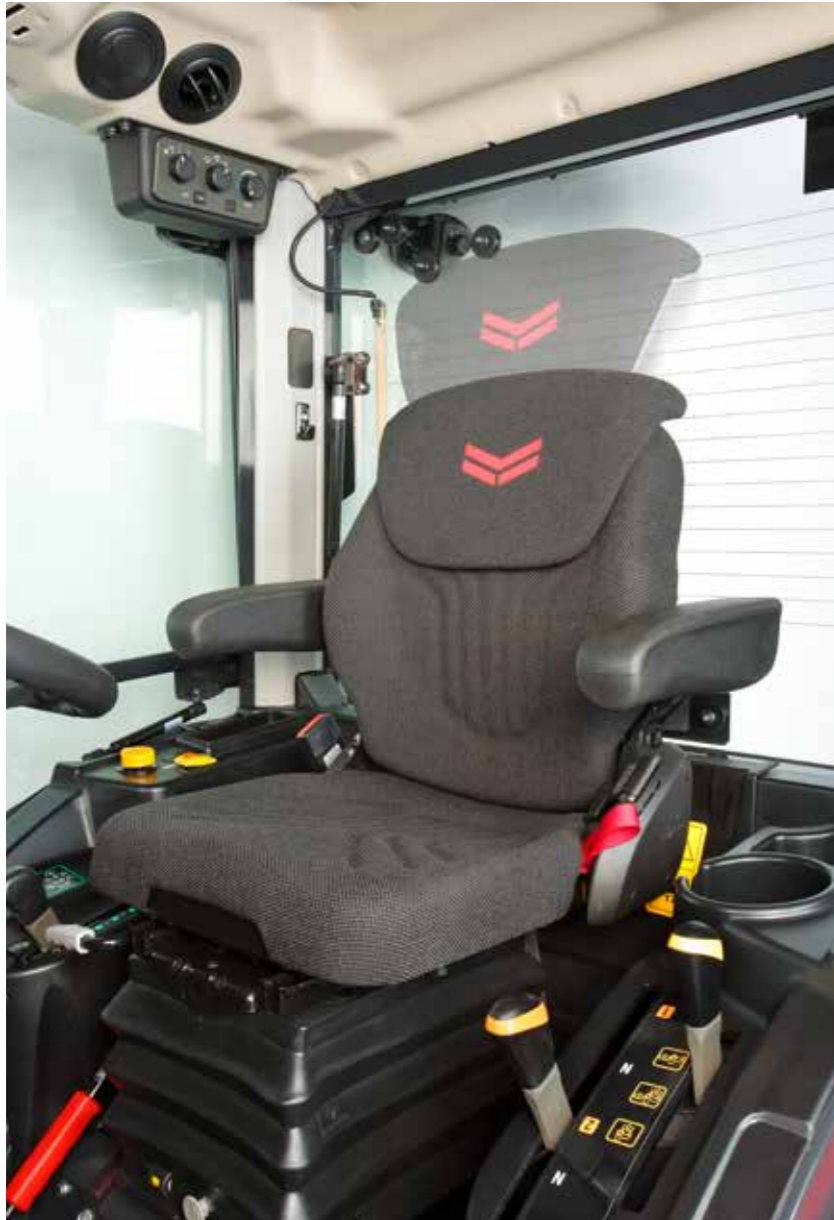
Luxussitz für optimalen Komfort