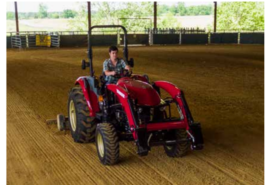
YT2-Traktoren vereinen eine Vielzahl funktionaler Eigenschaften und Merkmale – ein wahres Vergnügen für Eigentümer und Fahrer

Eine Höchstgeschwindigkeit von 31 km/h ermöglicht einen schnellen Ortswechsel zwischen den einzelnen Arbeitsstätten dank der Straßen- und Geländegängigkeit auf PKW-Niveau.