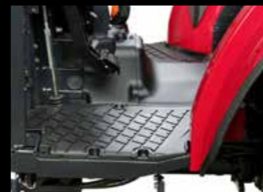
Ein ebener Boden sorgt für viel Beinfreiheit