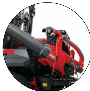
PORTE-OUTILS UNIVERSEL 136-1664