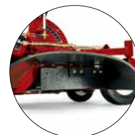
KIT GOULOTTE COMMANDÉE PAR L'UTILISATEUR (30070 UNIQUEMENT) 115-4190