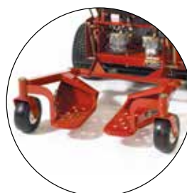
PLATEFORME DE CONDUITE SULKY 30110