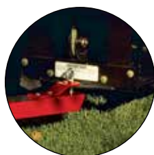
KIT D'ATTELAGE 109-9487