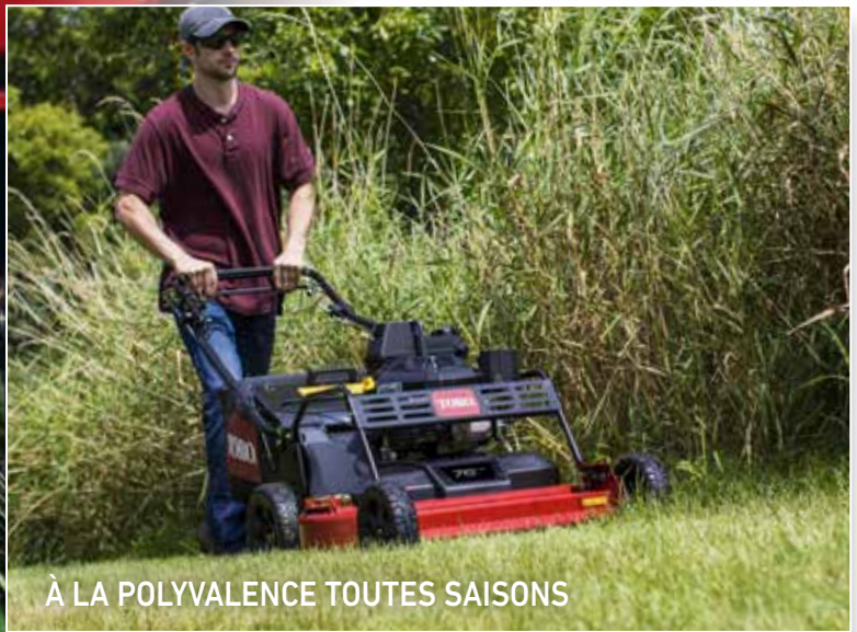
À LA POLYVALENCE TOUTES SAISONS

©2017 The Toro Company. Tous droits réservés.