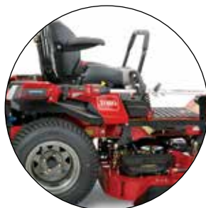
MONTAGE DE DÉBROUSSILLEUSE 136-1682