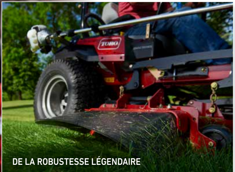
DE LA ROBUSTESSE LÉGENDAIRE