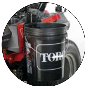
SUPPORT DE SEAU 136-1654