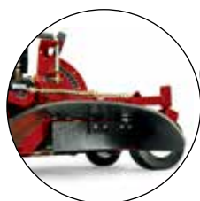
GOULOTTE D'ÉJECTION COMMANDÉE PAR L'UTILISATEUR 117-3600