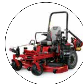
KIT TRIPLE SUPPORTS (avec porte-seau, montage universel et montage pour débroussilleuse) 136-1665